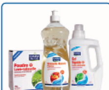
Detergenți vase ECO