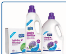
Detergenți textile ECO